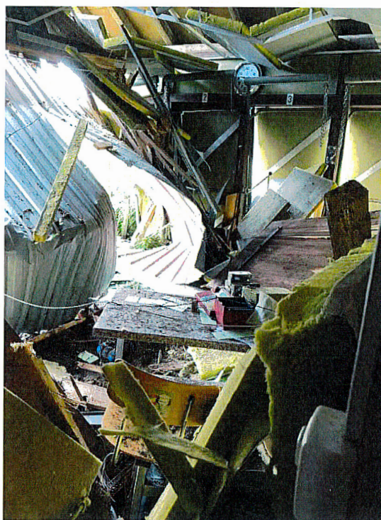
Aperçus des dégâts causés lors de l'accident de circulation

Dès lors, la société se trouve devant 3 possibilités :